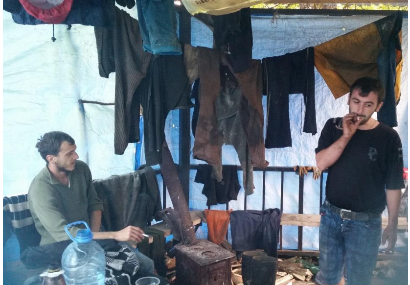
Et team af kogleplukkere har indrettet sig på en picnicplads i skoven.

humøret højt uanset vejrliget. Det er vigtigt for os, at kogleplukkerne er klar, når vejret tillader arbejde i skoven.