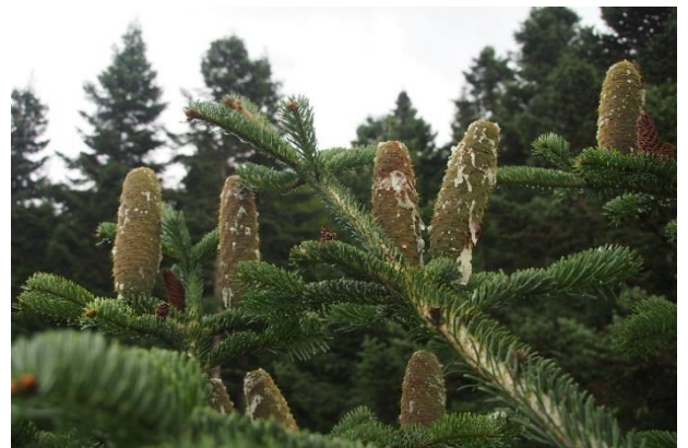
Gode kogler i afd. 2 og enkelte som ikke udviklede sig i 2016.